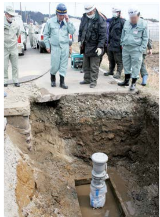
東日本大震災の漏水修理の様子

で同時に水道管が壊れたので、直すのに時間がかかりました。地震では、水道管だけでなく水道水を作る浄水場や水を配るために水を貯めておく配水池が壊れた所もありました。浄水場や配水池は、建物が大きかったり、大切な機械が動いているため、直すのに時間がかかることが多いです。そして海から襲った津