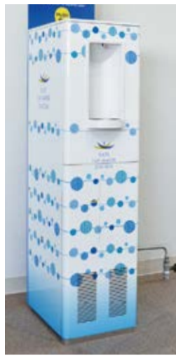
福島県・伊達市のDATE TAP-WATER STATION

これまで、公園などで水を飲む蛇口などにはありましたが、ボトルディスペンサーはボトルへの給水を想定したものです。各地の水道局や環境関係の部局などで、屋外や市役所などの施設への設置が進められています。