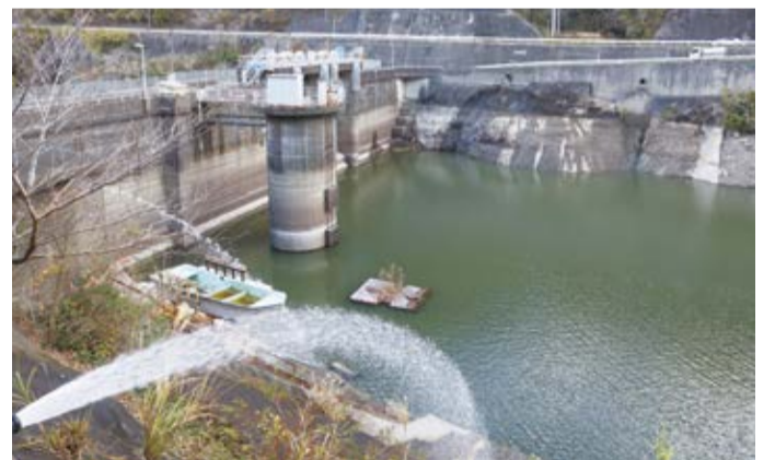
南房総市の湯水でははなれた川からダムに水を補充した

で起こった湯水は、約2か月間まとまった雨がふらなかったことが大きな原因になりました。 新型コロナウイルスが流行しているのに、手洗いやうがいのためにも水が使えなくなると大変です。 南房総市では、はなれた川から水がなくなりそうなたまに水を運んだり、水をたくさん使う施設には近くの町から水道水を運んだりして、水が使えなくなることから守りました。