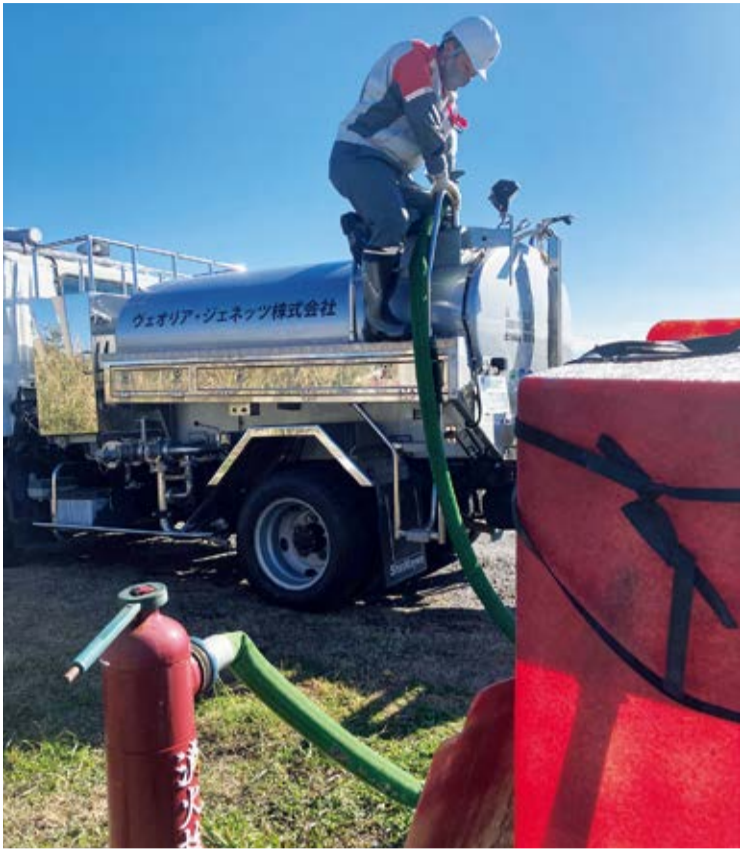
湯水ではたくさん水を使う施設などに給水車で水を届けた

この冬、いくつかの町で、使える水が少なくなる「湯水」が起こりました。 最近夏に多くの豪雨災害が起こっているのに、水が無くならないのは信じられないかもしれません。ダムに貯めておける水には限りがあるので、どの季節でも長い間雨がふらないと湯水は起こります。 豪雨災害が多くなったのは気候変動が原因だと言われています。地球が暖かくなると、海水や地表の水の温度も上がって、雨のもとになる水の蒸発の量が多くなり、雨がたくさんふる原因の一つになります。 じつは、温暖化は豪雨だけでなく、湯水の原因にもなりま