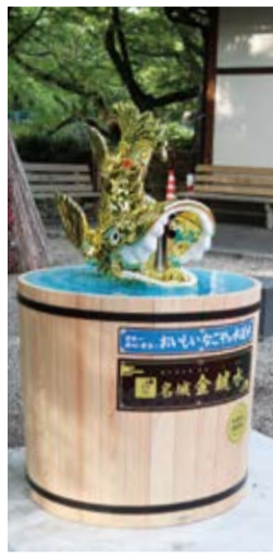
名古屋市の名城金鯱水