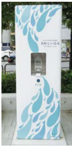
神奈川県・鎌倉駅前のウォーターステーション