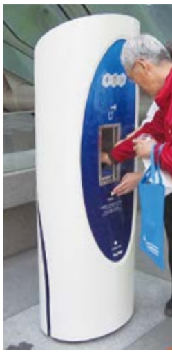
東京都のTokyowater Drinking Station